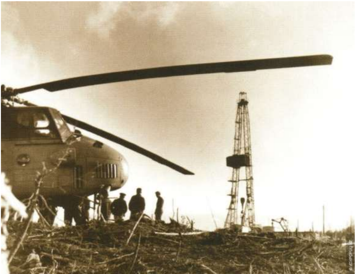
Разработка месторождений нефти в Мангистау, 1960-е годы.