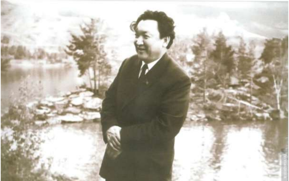
Шахмардан Есенов в 1970-е годы.

Шахмардан Есенов был одним из учеников другого видного геолога – Каныша Сатпаева. Именно Сатпаев заметил молодого Есенова и способствовал быстрому развитию его карьеры.