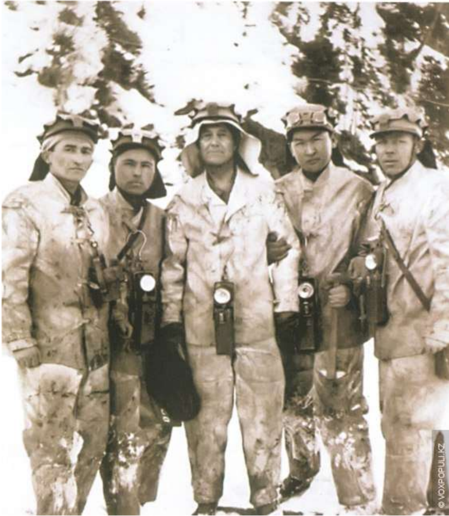
Шахмардан Есенов с коллегами-геологами в Жезказгане, 1950-е годы.

Спустя несколько лет после смерти Сатпаева, в 1967 году, в 39 лет Шахмардан Есенов возглавил Академию наук Казахской ССР, продолжив традиции развития науки, заложенные его учителем.